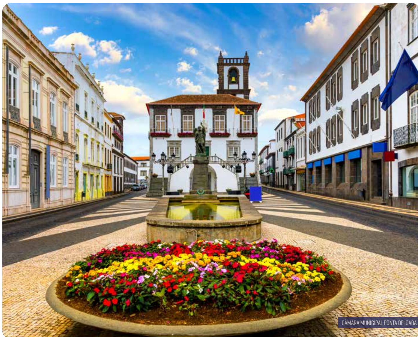
CÂMARA MUNICIPAL PONTA DELGADA

SETE CIDADES • FURNAS • CALDEIRA VELHA • LAGOA DO FOGO • PONTA DELGADA • NORDESTE • POVOAÇÃO • RIBEIRA QUENTE