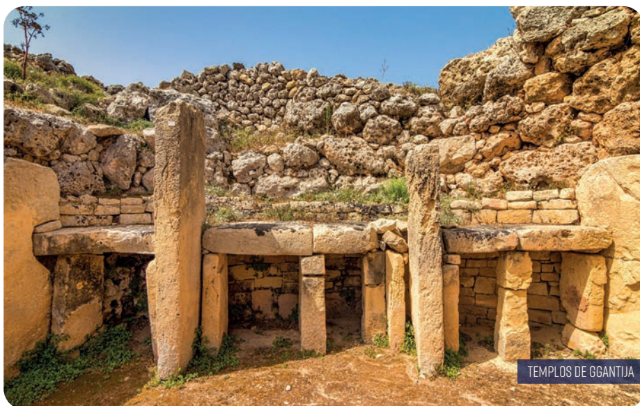
TEMPLOS DE GGANTJA

to, considerado um dos mais belos da Europa. Regresso ao hotel, jantar e alojamento.